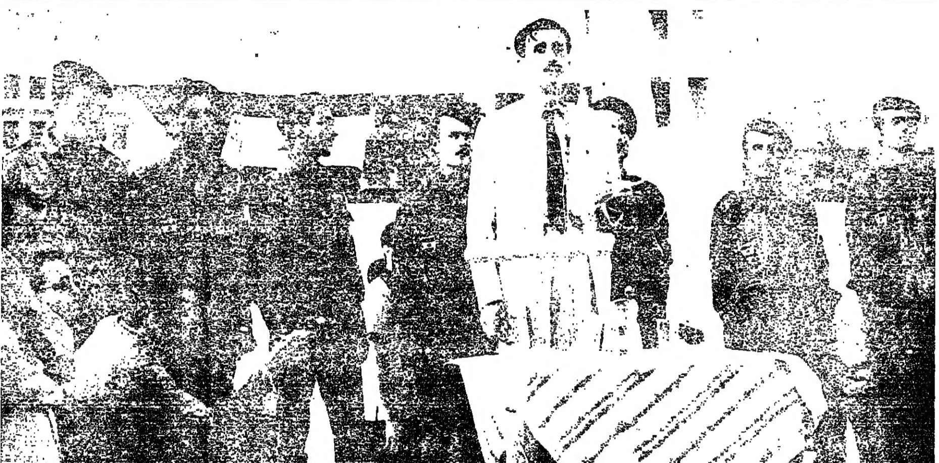
■ في مهرجان حرس ■